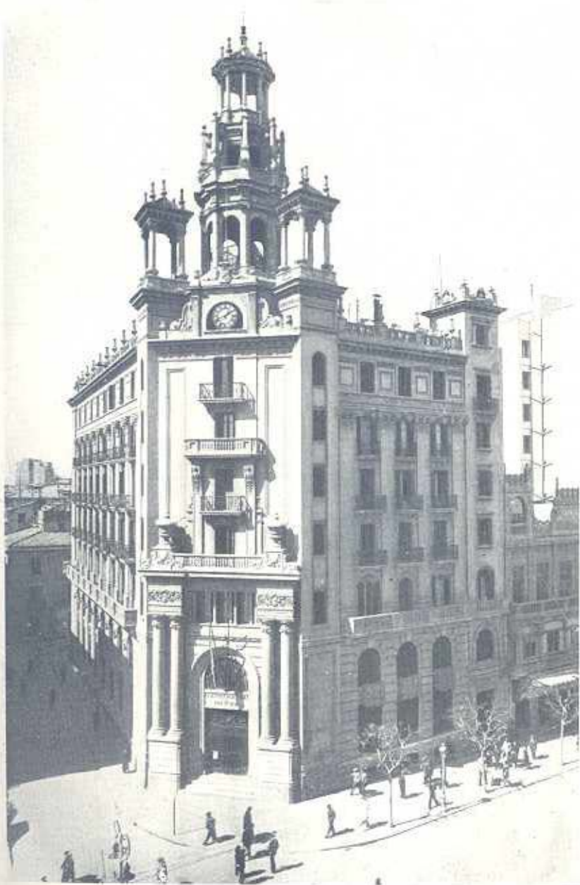
Delegación Provincial del Instituto en Valencia.