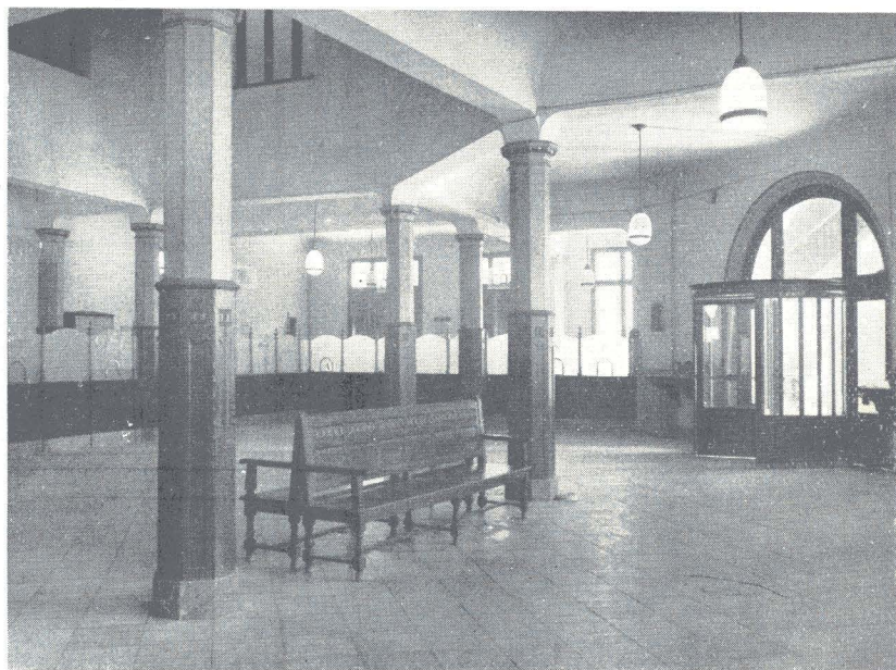
Delegación Provincial del Instituto en Valencia: Sala de operaciones.